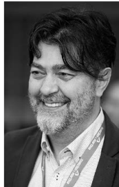
Antonello Di Felice